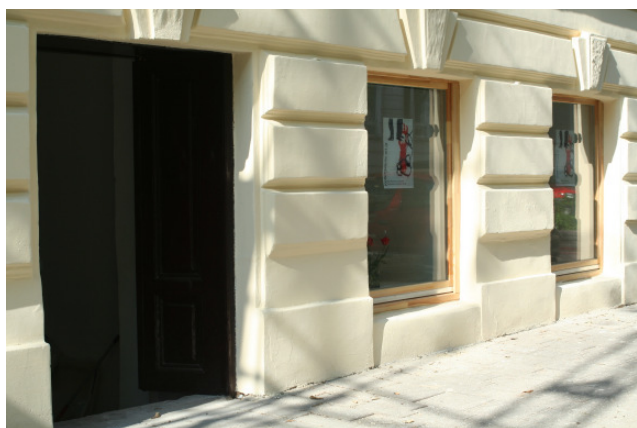
Abbildung 1: Kellergalerie art.ig

Die Ergebnisse der Künstlerkolonie Erdöszöllö „Artcamp“ mit Künstlern aus Deutschland, Polen, Ungarn, Österreich und der Slowakei, werden jeweils im Herbst gezeigt.