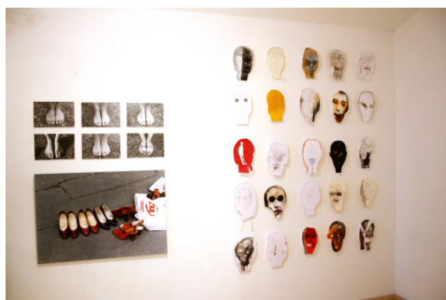
Abbildung 4: Ausstellung ArtCamp 2007

Gute Kunst kann leistbar sein. So werden bei der Weihnachtsausstellung kleine Originale zwischen 60 und 150 Euro angeboten.