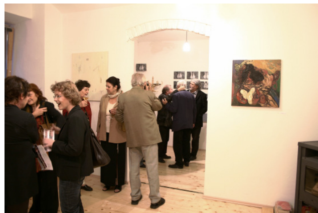
Abbildung 5: Vernissage

Artig wollen wir nicht sein, wir wollen eine Interessensgemeinschaft für Kunst bilden. Kommen Sie vorbei!